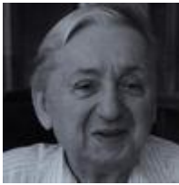
b-Szakcsi Lakatos Béla