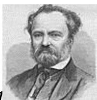
Joseph Haydn – nem Magyarországon született